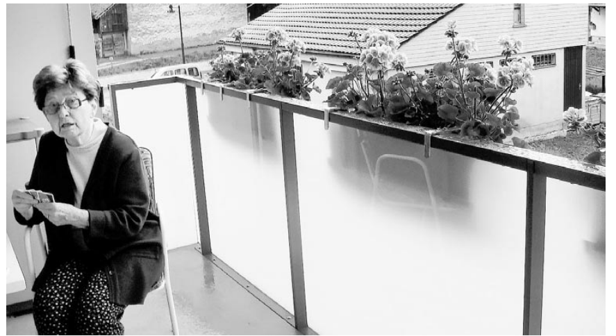
Alterswohnungen mit viel Luft und Licht.

Auch auswärtige Mieter sind im Geissbrunnen eingezogen, aus den Kantonen Bern und Solothurn. Sie haben ihre Töchter oder Söhne in der Nähe und diese sind froh, ihre Mütter oder Väter öfters besuchen zu können, oder sie bei Unpässlichkeiten zu pflegen. Auch jüngere Menschen haben hier eine Wohnung gefunden, in der sie sich sehr wohlfühlen.